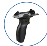
一/二维 扫描头手柄